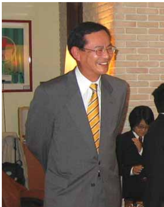
満面の笑みの社長

早いものでもう7月となり、夏季賞与の支給時期となりました。期末の部署業績は冬季に一括して反映されますが、経理部より発表された期末見通しによると、受注・完成工事高ともに昨年を上回る見通しで、受注額は433億5百万円(昨年比+30億83百万円)、完成工事高は403億24百万円(昨年比+12億27百万円)となる見通しです。しかし4月号の社内報でもお話したように、大幅な原価超過が4件発生したため、今のところ経常利益は9千万円にとどまり、前年比マイナス2億83百万円となる見込みです。このため、挽回に向けての活動を全社挙げて行っており、効果も出始めています。社員各位はこれから期末までの間、新たな損失を発生させぬよう気を引き締めて業務にあたってくださいようお願いします。