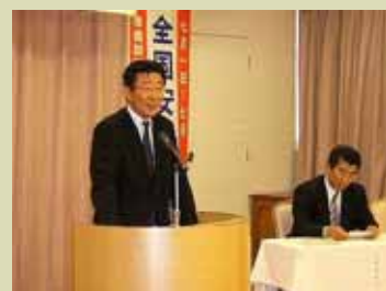
芹川支店長の挨拶

6月13日「三井ア・バンホテル博多」にて沖縄、大分、熊本、長崎からも出席者があり、約60名の参加となった。