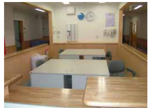
オープンスペース

当施設は、常磐線土浦駅から車で30分ほどの距離にあります。移動中にはわが国第2位の面積を誇る湖「霞ヶ浦」を右手に望み、レンコン(特産品)水田と田畑というのどかな田園風景を楽しむ事ができます。